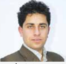
بقلم: الاستاذ رنا الشوبل

أختتم مؤتمر الأردنيين في الخارج نهاية شهر تموز والذي توج برعاية ملكية سامية وبحضور جمع غفير من المغتربين الأردنيين من غالبية بلدان العالم، والذي استمر ليومين متتاليين، بحث فيه وبجلسات متخصصة بأوقات متزامنة ما يجول في كل بلال مغترب من تشجيع للاستثمار وفرص التعليم والكثير من المواضيع التي نوقشت ونأمل بأخذ توصيات ونتائج المؤتمر لنراها على حيز الوجود.