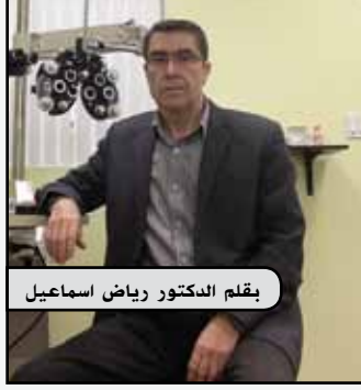
بقلم الدكتور رياض اسماعيل